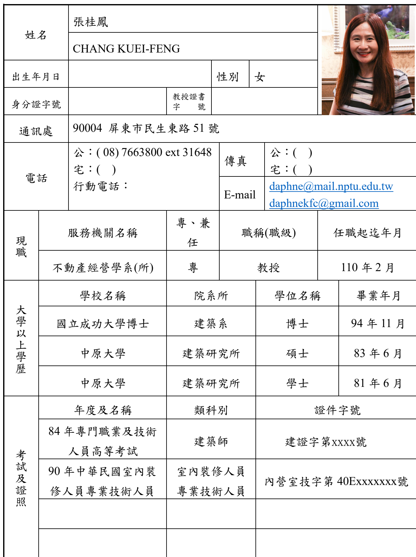
國立屏東大學管理學院第五任院長候選人基本資料表